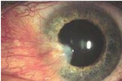
Figuur 1. Pterygium

Meestal groeit een pterygium vanuit de neuszijde van de oogbol over het hoornvlies. Ondanks dat er sprake is van groeiend weefsel en er bij de behandeling soms bestraling plaatsvindt, is dit géén kwaadaardige aandoening. Zie figuur 1.