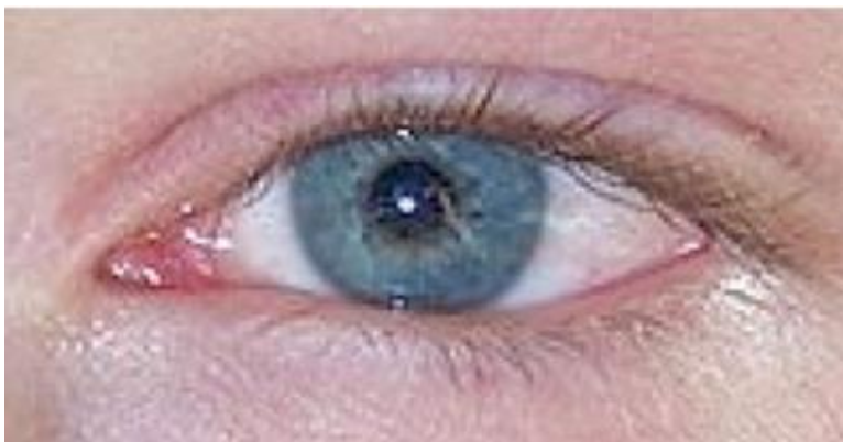
1. cornea linker oog met herpes takjes ter hoogte van pupilrand rechts

De ziekte begint meestal aan het oppervlak van het hoornvlies. Het oog wordt rood, is geïrriteerd en gevoelig voor licht.